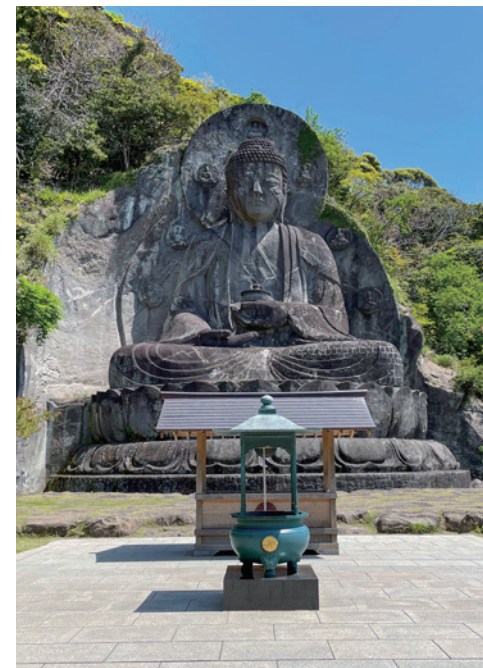
大仏（薬師瑠璃光如来）

江戸時代前期の1647年ころ、曹洞宗に改宗しています。1774年（安永3年）に、日本寺中興の祖といわれる高雅愚伝禅師が、現在の山腹に寺を移転させました。千五百羅漢もこの時発願されたものです。1553体にもおよぶ千五百羅漢の石仏群は、江戸時代の1779年（安永8年）から1798年（寛政10年）までの20年間、上総桜井（現在の木更津市桜井）の石工、大野甚五郎英令が、門弟27名とともに生涯をかけて刻んだものです。羅漢とは、正しくは阿羅漢といい、仏教の修行の最高段階に達した者のことです。さまざまな表情、姿の羅漢様たちが、さまざまな名前のついた参道の岩肌の洞窟に安置され、鋸山の幽玄な雰囲気をかもしだしています。この中には、ひとつとして同じ顔はないそうです。この羅漢様が鋸山を有名にし、江戸時代、「羅漢寺」とよばれ、おりしも江戸では「お伊勢参り」などの「参拝ブーム」「旅ブーム」が起こっていました。江戸から、船で木更津までのアクセスもよかった房州の「日本寺」は、多くの参拝客でにぎわう行楽地となりました。