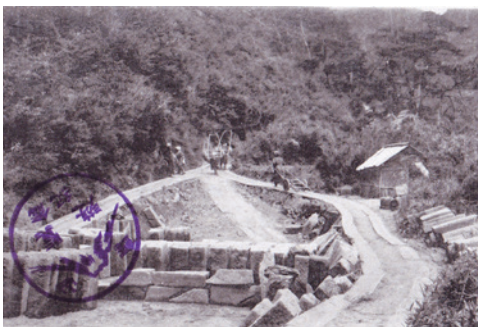
車力道 (明治期※推定)