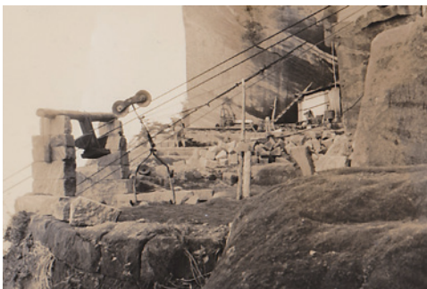
索道 (昭和40年代後半)